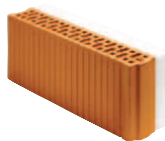
Porotherm vencová tehla (VT)