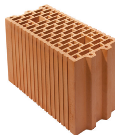
Porotherm 17,5 Profi