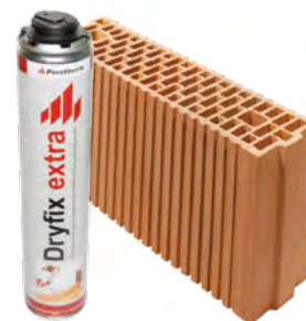
Porotherm 11,5 Profi Dryfix